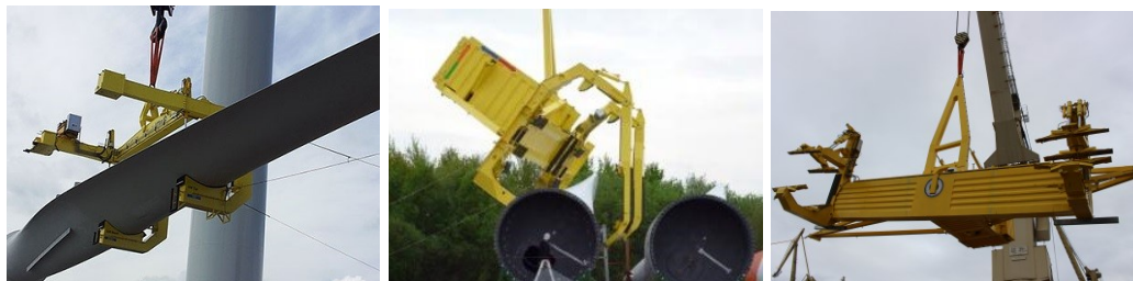
Liftra vingeåg (3 forskellige typer)

Liftra har udviklet en række forskellige løfte åg til vingeinstallation. Disse åg er igennem projektet blevet brugt som basis for beregninger på Tagline systemet. Vingeågene med navne som "Blade Dragon" og "Blade Yoke" kan løfte vinger med en længde på 70-90 meter med en totalvægt på åg og vinge på 90-120 tons. Styring af en byrde med sådanne dimensioner kræver mange forberedelser, hvorfor der i projektet blev brugt en stor del af tiden på matematiske samt skalerede modeller af systemet. Ved hjælp af disse modeller blev der designet forskellige typer af løsninger, som hver især tilgodeså omkostninger, tilgængelig kran og løfteåg. Der blev designet systemer med 2, 4 og 5 taglines, hvor resultatet viser, at jo flere taglines, jo bedre kontrol. Konsekvensen er selvsagt en højere omkostning og kompleksitet. Der er testet 2 og 4 taglines på en testopstilling hos Liftra. Grundet kundeønsker er kun systemer med 2 taglines kommercialiseret, omend Liftra er klar til at levere systemer med 4 taglines, såfremt det lykkes at overbevise en kunde om fordelene den nye teknologi.